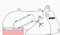
Modello con kit pinze