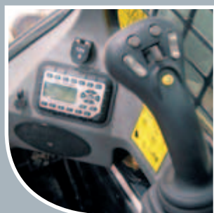
Predisposizione autoradio stereo MP3 compatibile e presa da 12 V, SJC

Le pale caricatori Bobcat di nuova generazione offrono una cabina pressurizzata ai vertici della categoria, con una nuova tenuta in un unico pezzo che segue integralmente il profilo del portellone e si inserisce in un incavo curvo appositamente predisposto, impedendo l'ingresso di sporco e polvere nell'abitacolo. I livelli sonori sono stati ridotti di oltre il 60% per migliorare ulteriormente il comfort dell'operatore.