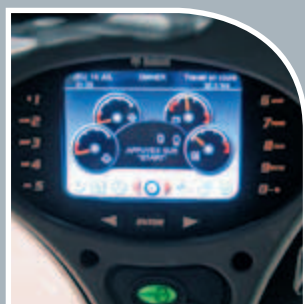
Cruscotto Deluxe a colori