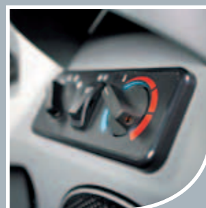
Riscaldamento e aria condizionata