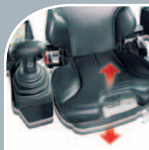
Sedile confortevole a sospensione completamente regolabile